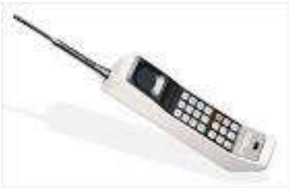
Prototipo Dyna-tac 80000X