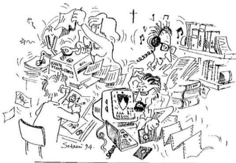
Koinonia: Redazione e dintorni