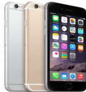
Nuovo Modello Iphone 6